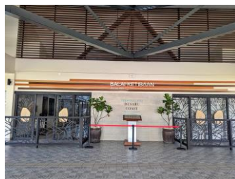
デサルフェリーターミナル

【 タナメラフェリーターミナル 】 (ターミナル外) ミニマート、両替所、カフェ (ターミナル内) 免税品店、ドリンク売店 【 デサルフェリーターミナル 】 両替所、ミニマート、ATM、免税品店