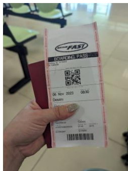
フェリーチケット