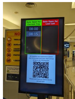
出発ゲート前の看板 シンガポール空港から約10分 (約18~20SDG)