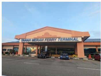
タナメラフェリーターミナル シンガポール空港から約10分 (約18~20SDG)