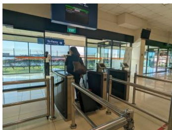
搭乗時間になったら、 チケットのQRコードをスキャンして入場 ※ゲートにスタッフはいないので、 乗り遅れないよう注意！