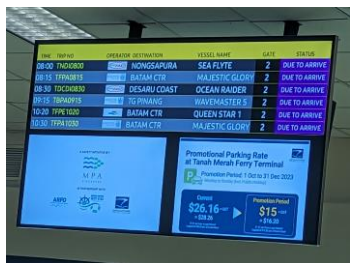
電光掲示板でゲートを確認