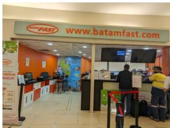
バタムファスト チケットカウンター 午前7時にオープン (フェリー出発の1時間前までに要到着) 予約確認書とパスポートを持参し、 チケットに交換手続きを行う