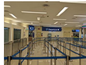
出発ゲート 荷物検査&シンガポール出国手続きへ